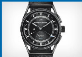
Juwelier Nadler Porsche Design Globetimer – präzise auf die Sekunde.