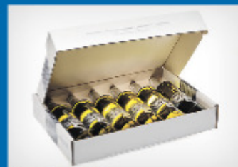
Hirschmugl-Domaene Steirische Weine vom Seggau zum Kosten und Genießen.