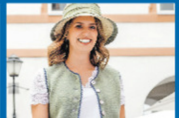
Salzburger Heimatwerk Hochwertige Trachten und modische Einzelstücke für Damen.